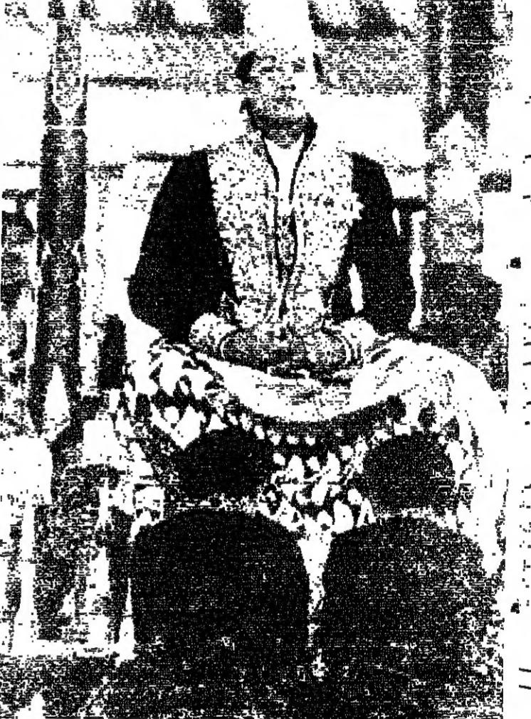
الامير ماغويومي، الذي اصبح الآن سلطان جونغاكركا الجديد، تحت اسم هامغويونو العاشر، يجلس على عرشه اثناء حفلة التتويج التي جرت امس الاول، في انغونيسيا - ر